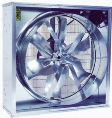
Destratificatore EMT30 completamente equipaggiato.

zone significative della serra e di pilotare adeguatamente il generatore termico. Un "bi-termostato" rende più sicuro il funzionamento del sistema: il ventilatore viene attivato solo quando la temperatura della camera di combustione e